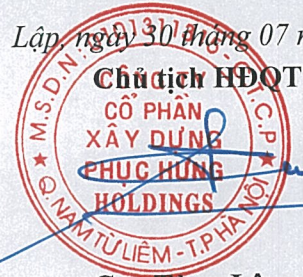
Cao Tùng Lâm